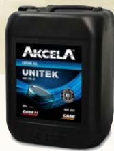
Akcela Unitek 10W40