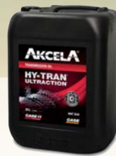
Akcela Hytran Ultraction