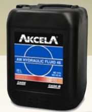
Akcela AW Hydraulic Fluid 46